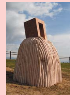
齋藤 徹 Sky and Earth "Circulation 2009"