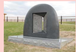
田中 等 The door of the wind