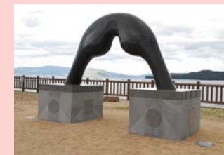
川島 猛 Gate-Muse Love