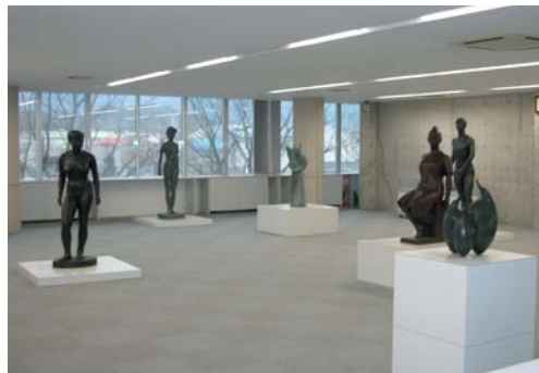
사에구사 소타로 작품

아지초 출신의 조각가이면서 화가 사에구사 소타로의 작품 807점과 서예가 히로세 후미의 작품 103점을 남동 2층 상설 전시장에 전시하고 있습니다. 가까와현 내의 모든 사람들이 아지초의 문화와 만날 수 있는 장소로 이용되고 있습니다.