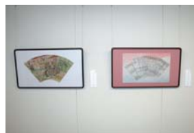
히로세 후미 작품